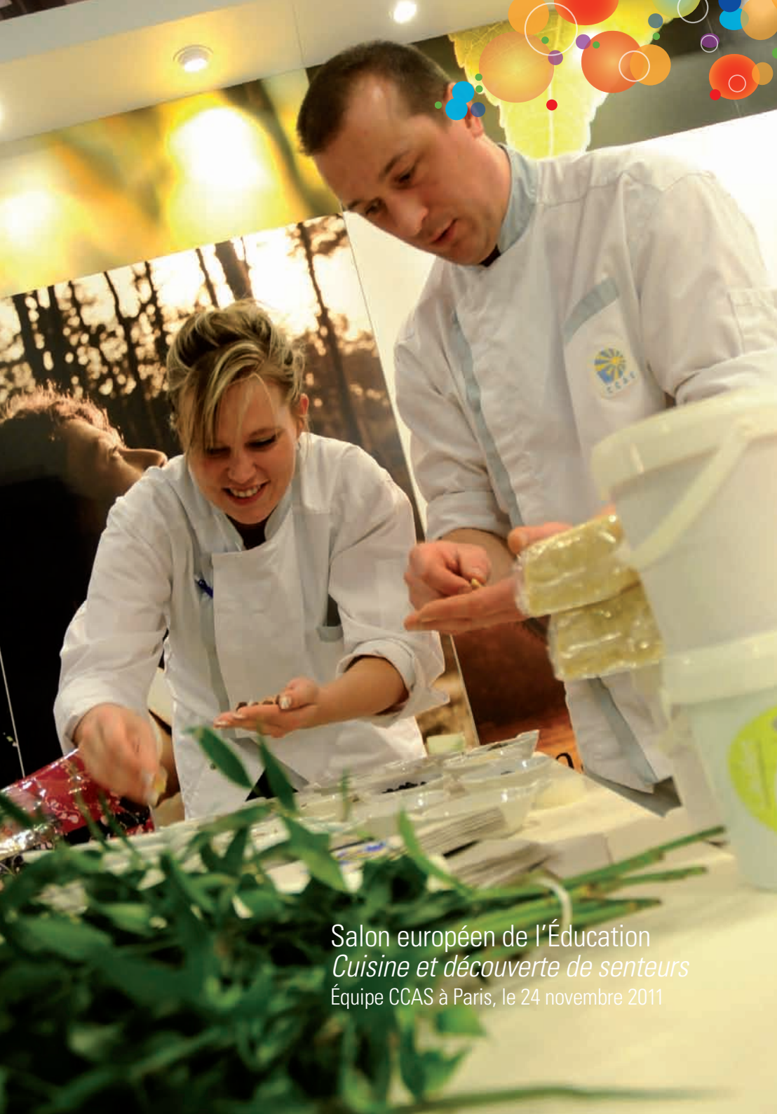
Salon européen de l'Éducation Cuisine et découverte de senteurs Équipe CCAS à Paris, le 24 novembre 2011